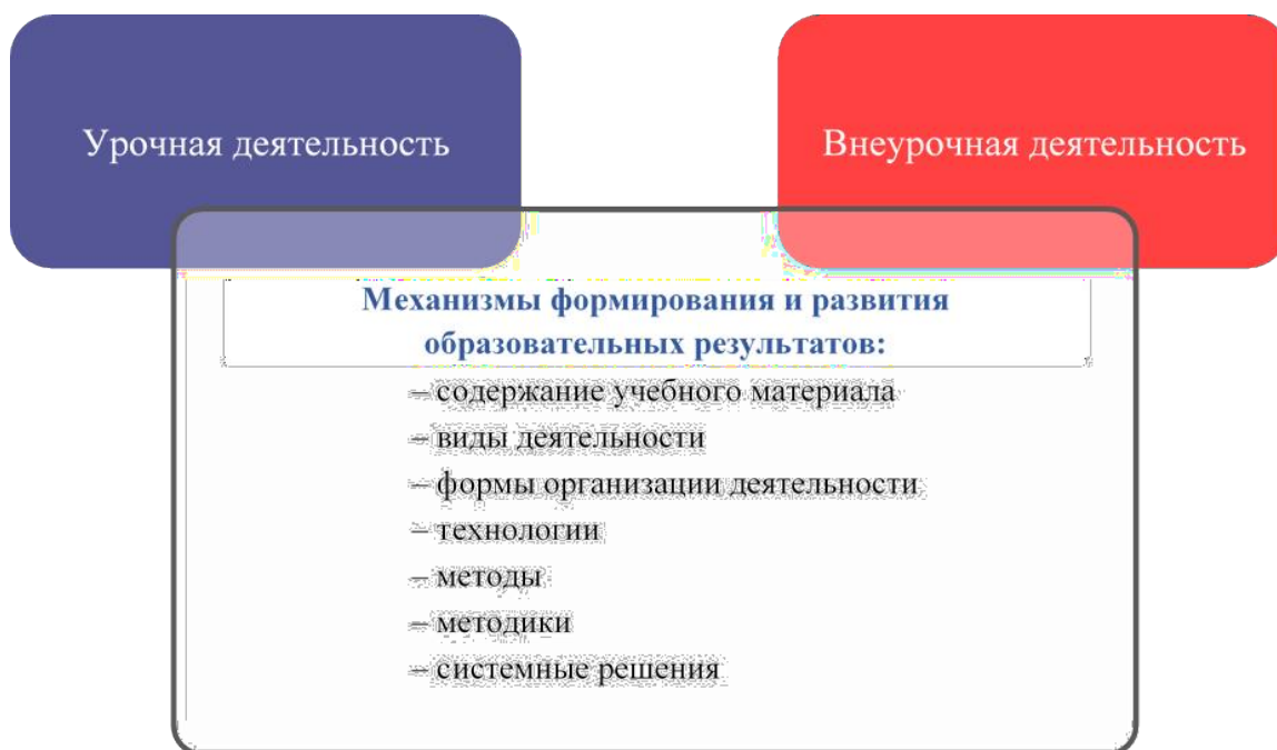
Рис. 2. Механизмы формирования и развития образовательных результатов

Предметные результаты освоения АООП НОО с учетом специфики содержания предметных областей включают освоенные обучающимися знания и умения, специфичные для каждой предметной области, готовность их применения.