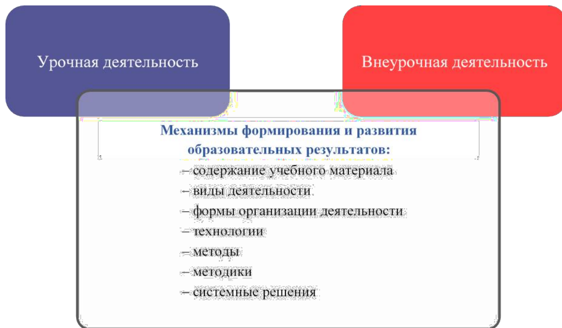
Рис. 2. Механизмы формирования и развития образовательных результатов